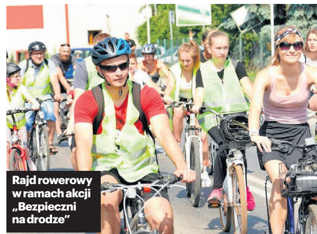
Rajd rowerowy w ramach akcji „Bezpieczni na drodze”

Młodzi ludzie mieli okazję dowiedzieć się, że jesienią i zimą widoczność na drodze jest ograniczona, kierowca często nie jest w stanie dostrzec pieszego z odległości większej niż 20 metrów,