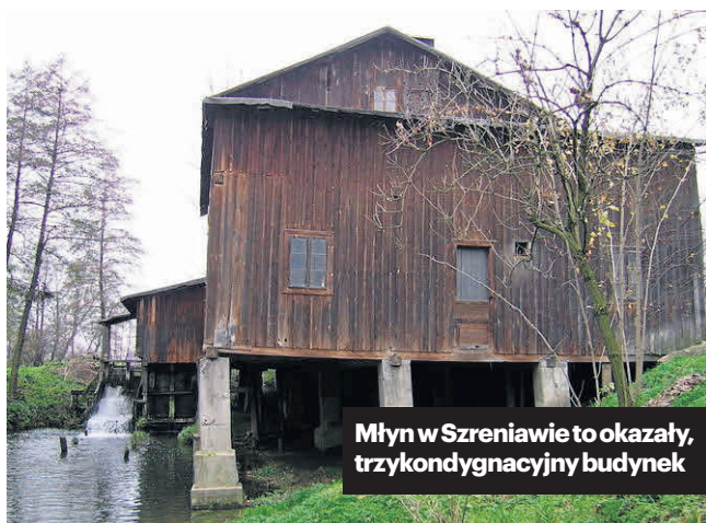
Młyn w Szreniawie to okazały, trzykondygnacyjny budynek