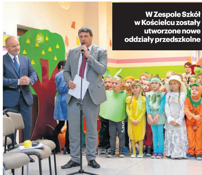
W Zespole Szkół w Kościelcu zostały utworzone nowe oddziały przedszkolne

Warto podkreślić, że gmina Proszowice nie tylko realizuje inwestycje w placówkach oświatowych, ale także uczestniczy w różnych programach eduka-