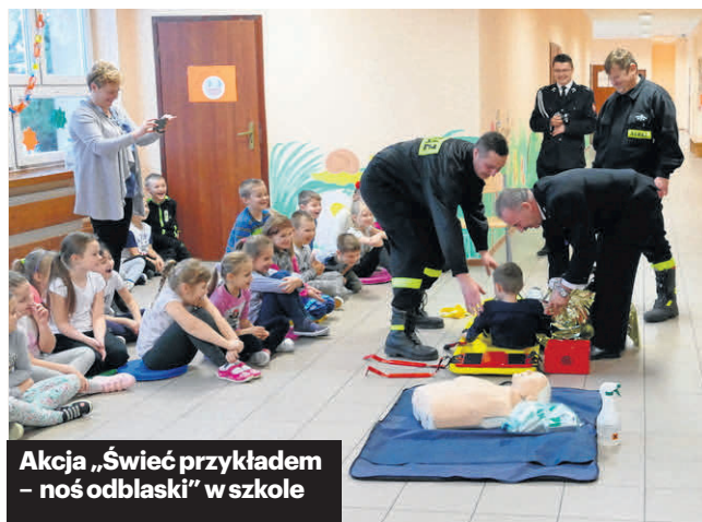
Akcja „Świeć przykładem – noś odblaski” w szkole

W ramach programu druhowie prezentowali uczniom w szkołach podstawowych instruktaż udzielania pierwszej pomocy, demonstrowali, w jaki