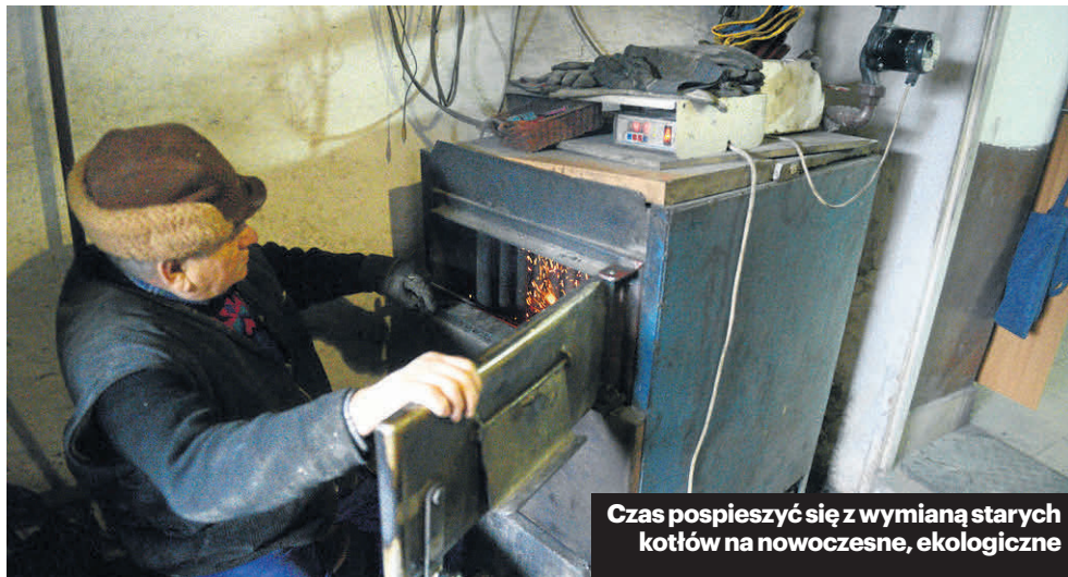
Czas pospieszyć się z wymianą starych kotłów na nowoczesne, ekologiczne

Z badań wynika, że smog przyczynia się do śmierci ponad 4 tysiące Małopolan rocznie, a koszty leczenia mieszkańców naszego regionu szacuje się na 3 mld zł rocznie. To dlatego specjaliści w dziedzinie ochrony