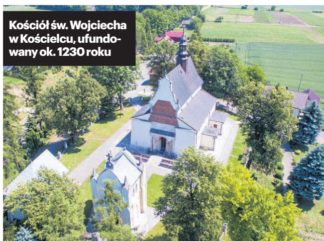
Kościół św. Wojciecha w Kościelcu, ufundowany ok. 1230 roku

będąc w Kościelcu, koniecznie trzeba zajrzeć do kościoła św. Wojciecha. Ufundował go około 1230 roku biskup krakowski Wisław z Kościelca. Ta romańska bazylika - zbudowana z kostki wapiennej uzupełnianej cegłą i fragmentami z piaskowca - przetrwała bez większych zmian do drugiej połowy XVI wieku. Całość została mocno