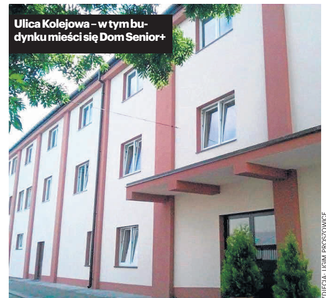
Ulica Kolejowa - w tym budynku mieści się Dom Senior+