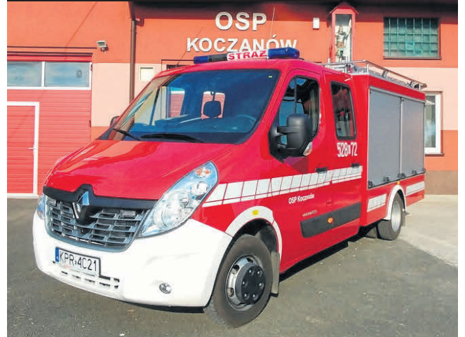
Nowy wóz ratowniczo-gaśniczy Renault Master dla jednostki OSP Koczanów

Warto również wspomnieć o programie „Małopolskie Remizy”, w ramach którego zrealizowano szereg niezbędnych inwestycji. Oddano do użytku nową remizę OSP Bobin oraz zmodernizowano strażnice należące do jednostek OSP: Makocice, Ostrów, Łaganów, Teresin, Górka Stogniowska, Jakubowice i Koczanów.