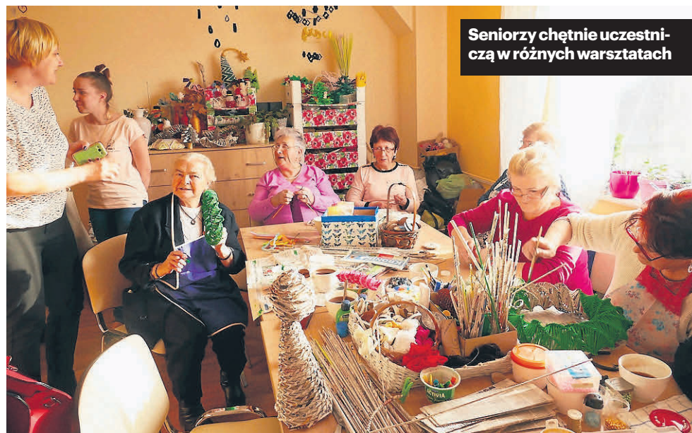
Seniorzy chętnie uczestniczą w różnych warsztatach

Adaptacja budynku przy ulicy Kolejowej na potrzeby