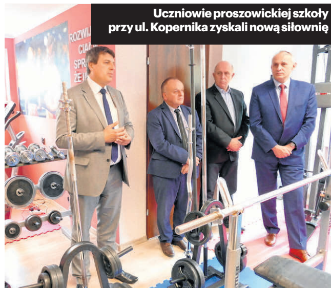
Uczniowie proszowickiej szkoły przy ul. Kopernika zyskali nową siłownię