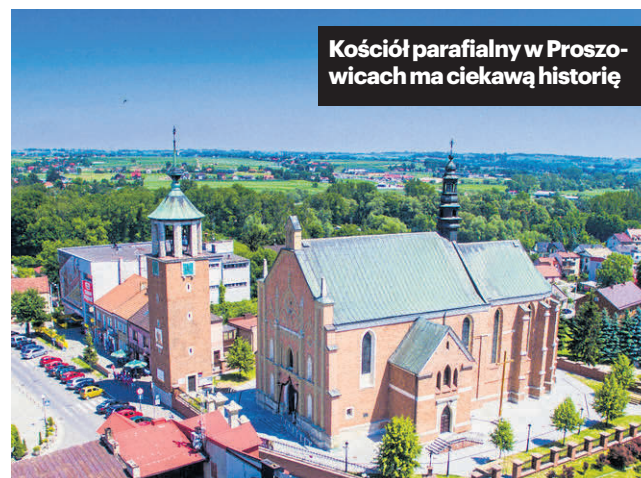
Kościół parafialny w Proszowicach ma ciekawą historię