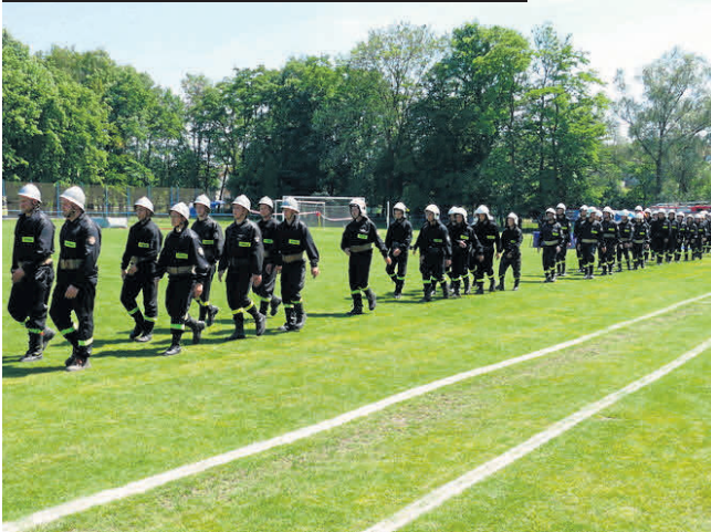
Tegoroczne Gminne Zawody Sportowo-Pożarnicze w Proszowicach