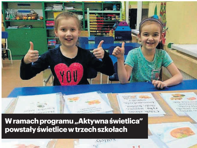
W ramach programu „Aktywna świetlica” powstały świetlice w trzech szkołach

W ramach tego projektu zostały utworzone świetlice w trzech szkołach: w Klimontowie, Kościelcu i w proszowickiej SP nr 1. Głównym celem jest tu bowiem wsparcie rodzin w ich funkcjach wychowaw-