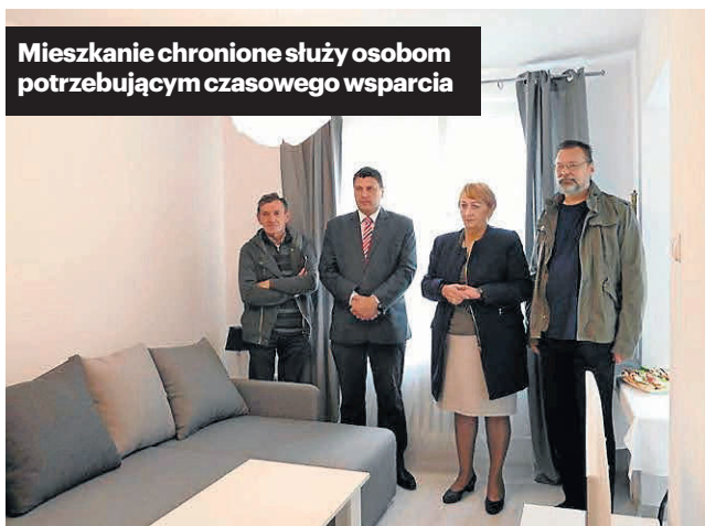
Mieszkanie chronione służy osobom potrzebującym czasowego wsparcia

czo-opiekuńczych poprzez zapewnienie dzieciom opieki (w tym specjalistycznej) oraz zajęć wspierających ich rozwój i aktywność.