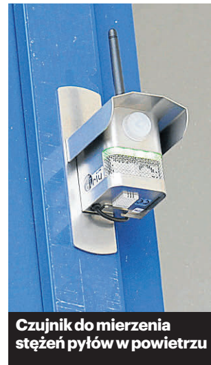
Czujnik do mierzenia stężeń pyłów w powietrzu

W nowej uchwale antysmogowej znalazły się także zapisy o zakazie stosowania paliw najgorszej jakości, czyli mułów i flotów węglowych. Nie wolno również używać mokrego drewna, czyli tego o wilgotności powyżej 20 proc. (by spełnić wymogi, należy sezonować drewno przez dwa lata).