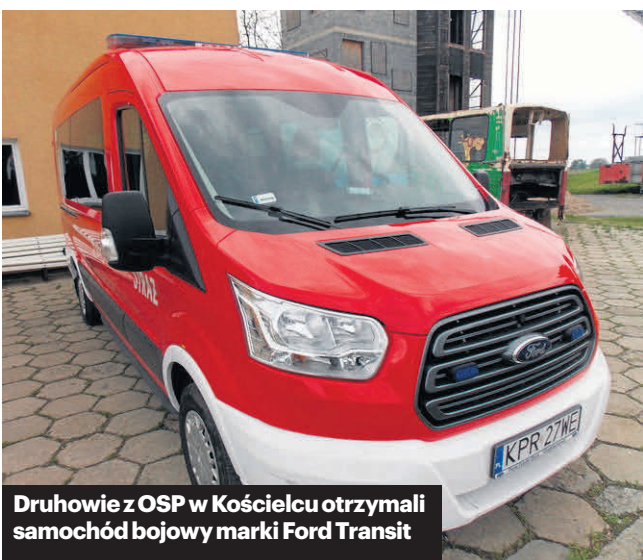
Druhowie z OSP w Kościelcu otrzymali samochód bojowy marki Ford Transit