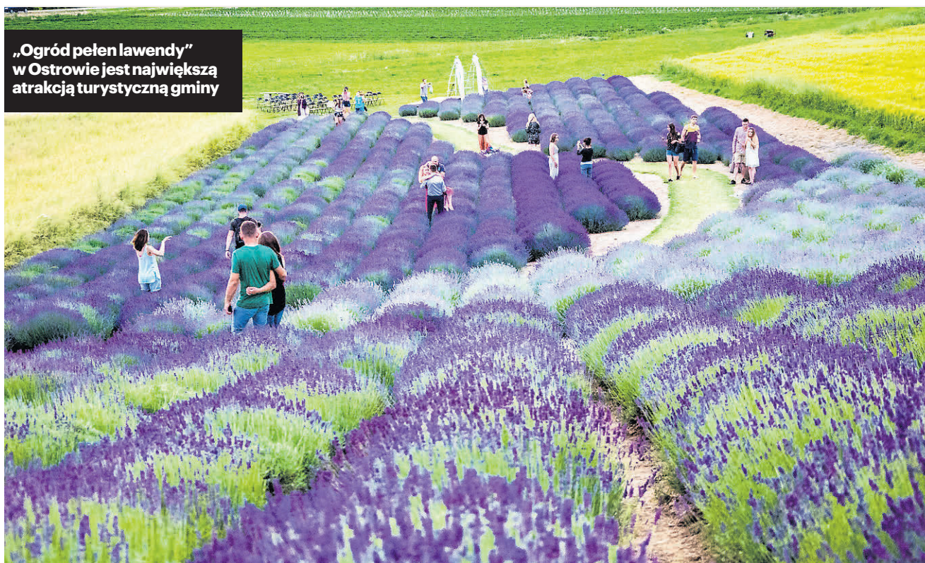
„Ogród pełen lawendy” w Ostrowie jest największą atrakcją turystyczną gminy

W gminie Proszowice coś dla siebie znajdują jednak nie tylko miłośnicy przyrody i pięknych krajobrazów, ale także osoby lubiące zwiedzać zabytki. Na przykład