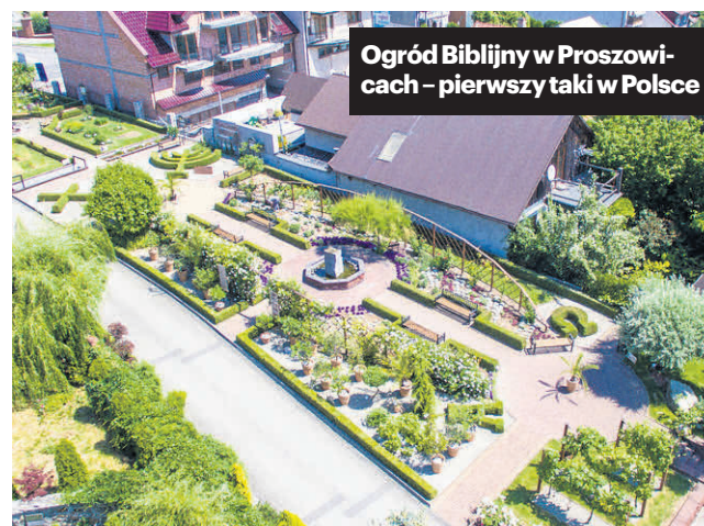
Ogród Biblijny w Proszowicach - pierwszy taki w Polsce

Warto również wybrać się do Żębocina, by zobaczyć tamtejszy kościół parafialny dedykowany św. Małgorzacie i św. Stanisławowi Biskupowi. Świątynię wzniesiono w połowie XIII wieku na wzgórzu. Charakter kościoła sytuuje go na styku architektury romańskiej i gotyckiej. Z pierwotnych szczegółów zachowały się zaledwie dwa