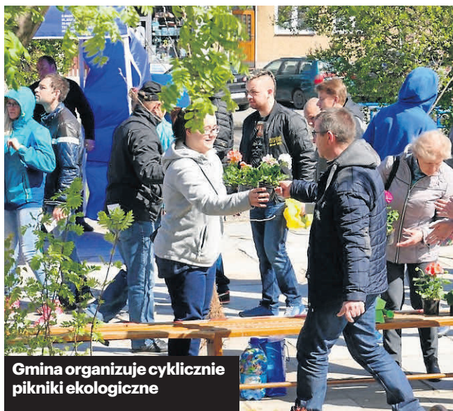
Gmina organizuje cyklicznie pikniki ekologiczne

Jeśli chodzi o ekologię, to niezwykle ważną jest tu również edukacja. Dlatego stale realizowane są działania edukacyjno-informacyjne dla mieszkańców. Ich celem jest m.in. zachęcanie dzieci, młodzieży szkolnej, nauczycieli do dbałości o środowisko w najbliższym otoczeniu. Służą temu organizowane cyklicznie pikniki ekologiczne, wiosenne i jesienne akcje sprzątania świata, czy też szkolny konkurs na zbiórkę surowców wtórnych „Klasa przyjazna dla środowi-