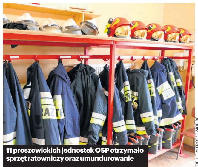
11 proszowickich jednostek OSP otrzymało sprzęt ratowniczy oraz umundurowanie