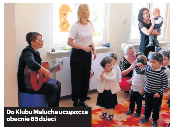
Do Klubu Malucha uczęszcza obecnie 65 dzieci

Całkowita wartość projektu „Autostrada kluczowych kompetencji” to blisko 2,2 mln zł, w tym dofinansowanie unijne wynosi ok. 1,85 mln zł.