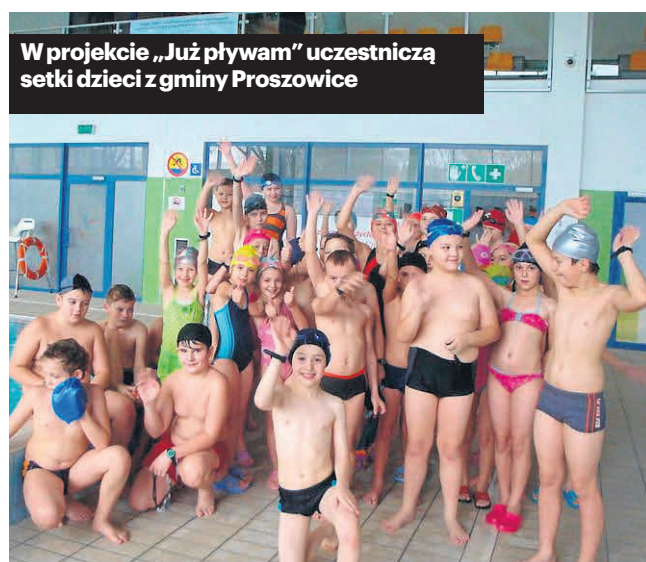
W projekcie „Już pływam” uczestniczą setki dzieci z gminy Proszowice

cyjnych. Wszyscy uczniowie drugich klas szkół podstawowych uczą się pływać w ramach lekcji wychowania fizycznego (nieodpłatnie). Uczniowie klas I-IV mają bezpłatne zajęcia pływania w ramach programu „Już pływam”.