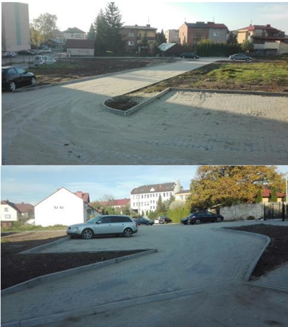
Nowy teren pomiędzy osiedlem Partyzantów a ZP Caritas.