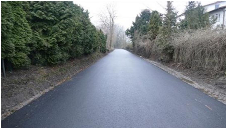
Droga w Gniazdowicach.

W ramach III promesy z dnia 15.11.2018 r. wykonano: